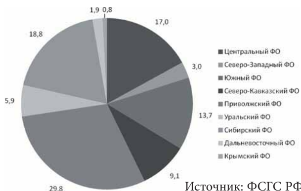
Рис. 1 – Структура производства крупного рогатого скота на убой в убойном весе в 2015 г. по федеральным округам (в хозяйствах всех категорий), %

На сельскохозяйственные организации страны приходится 31,9–32,4% производимой в отрасли скотоводства на убой мясной продукции (525,9–529,9 тыс. т в абсолютном выражении), в динамике