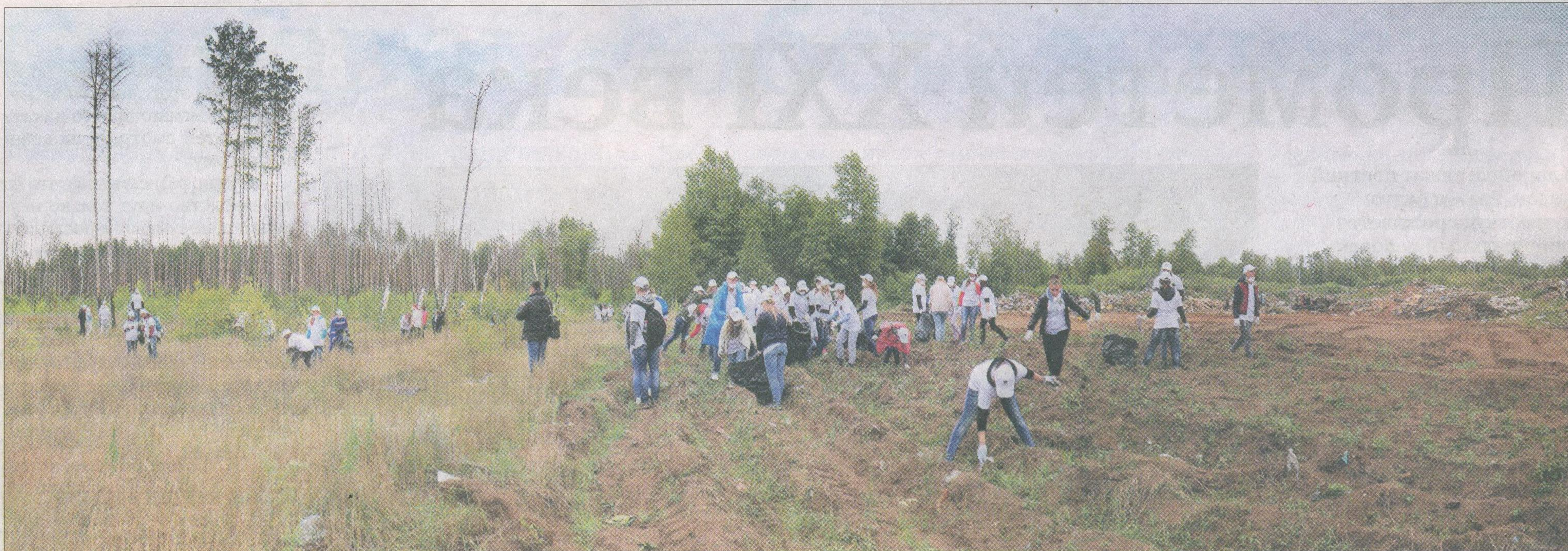
Сотни добровольцев разбрелись вокруг свалки по лесу, собирая в огромные мешки мусор.