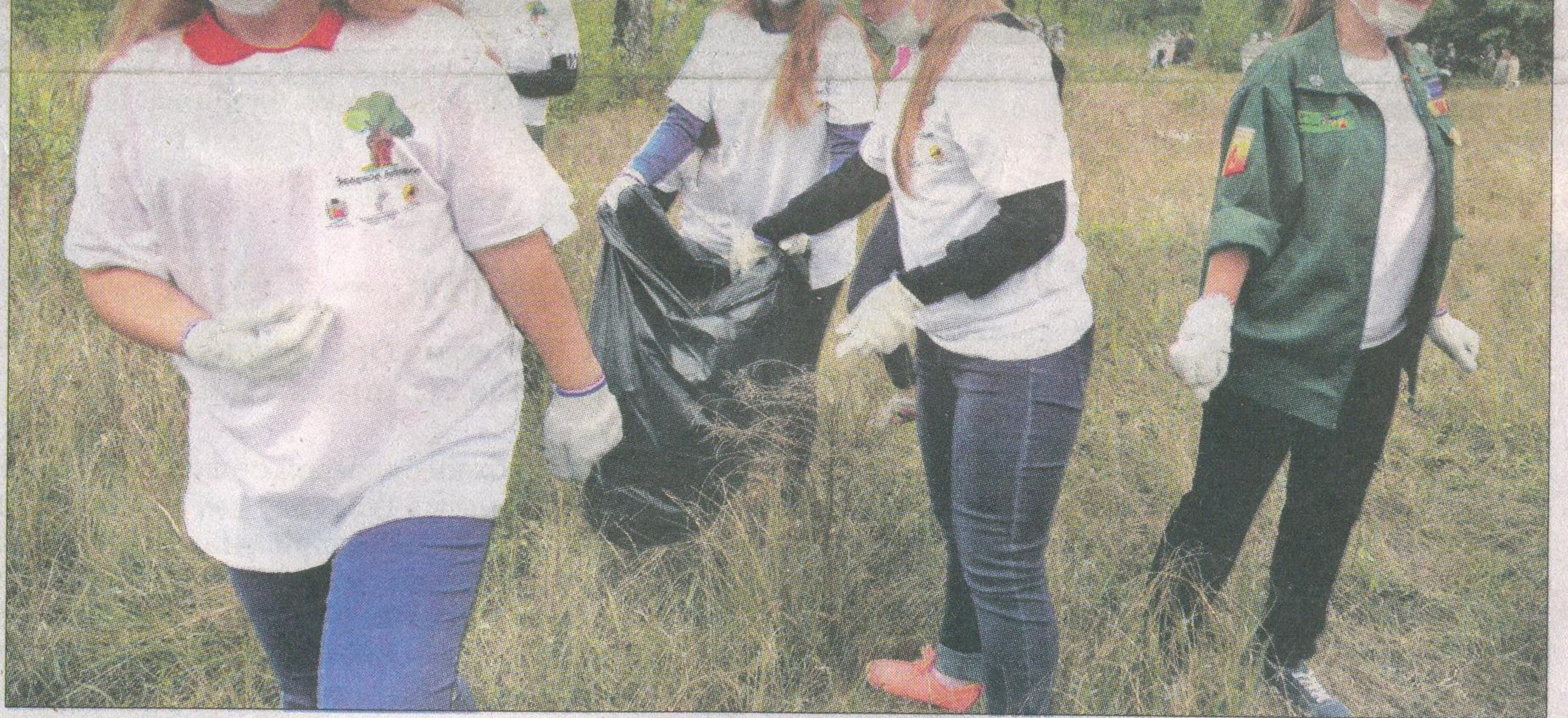
Бузулукский бор впервые принимал столько желающих сделать его чище и здоровее.

Не случайно говорят, что со временем глаз замыливается