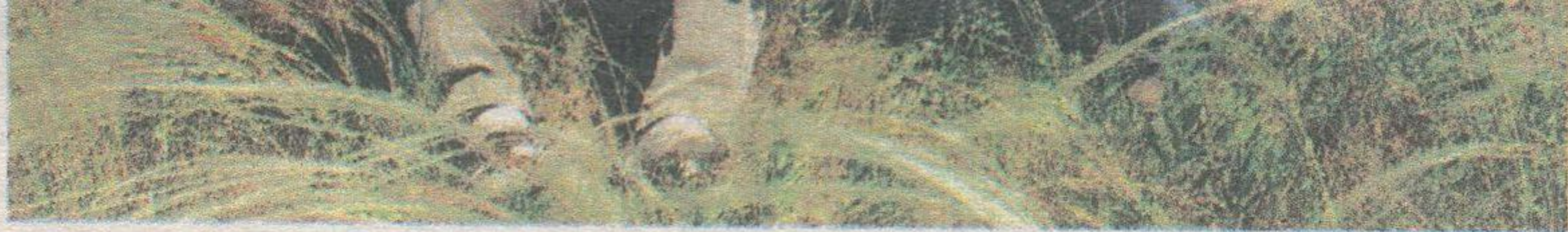
На полянке Бузулукского бора вместе с автором публикации.