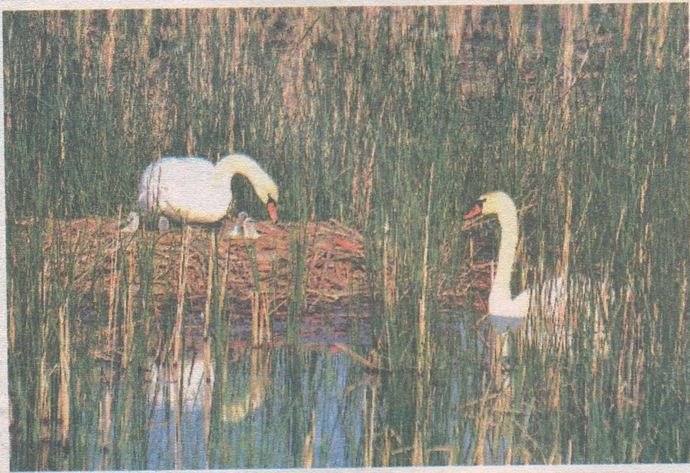
В день приезда Пескова в Аксаковском пруду появились птенцы лебедя.