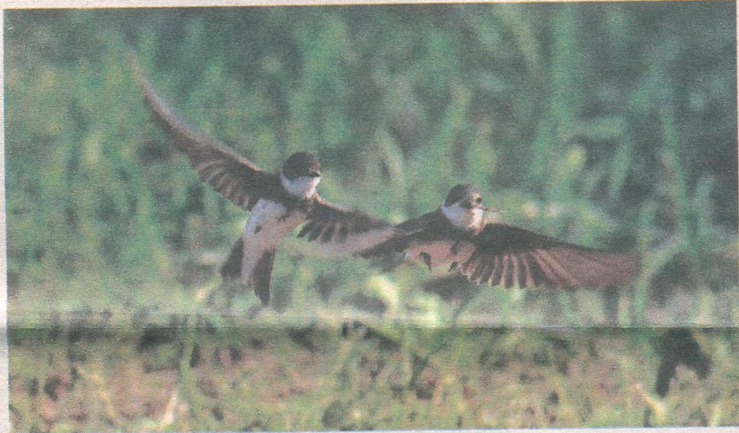
Ласточки береговушки строят гнездо.