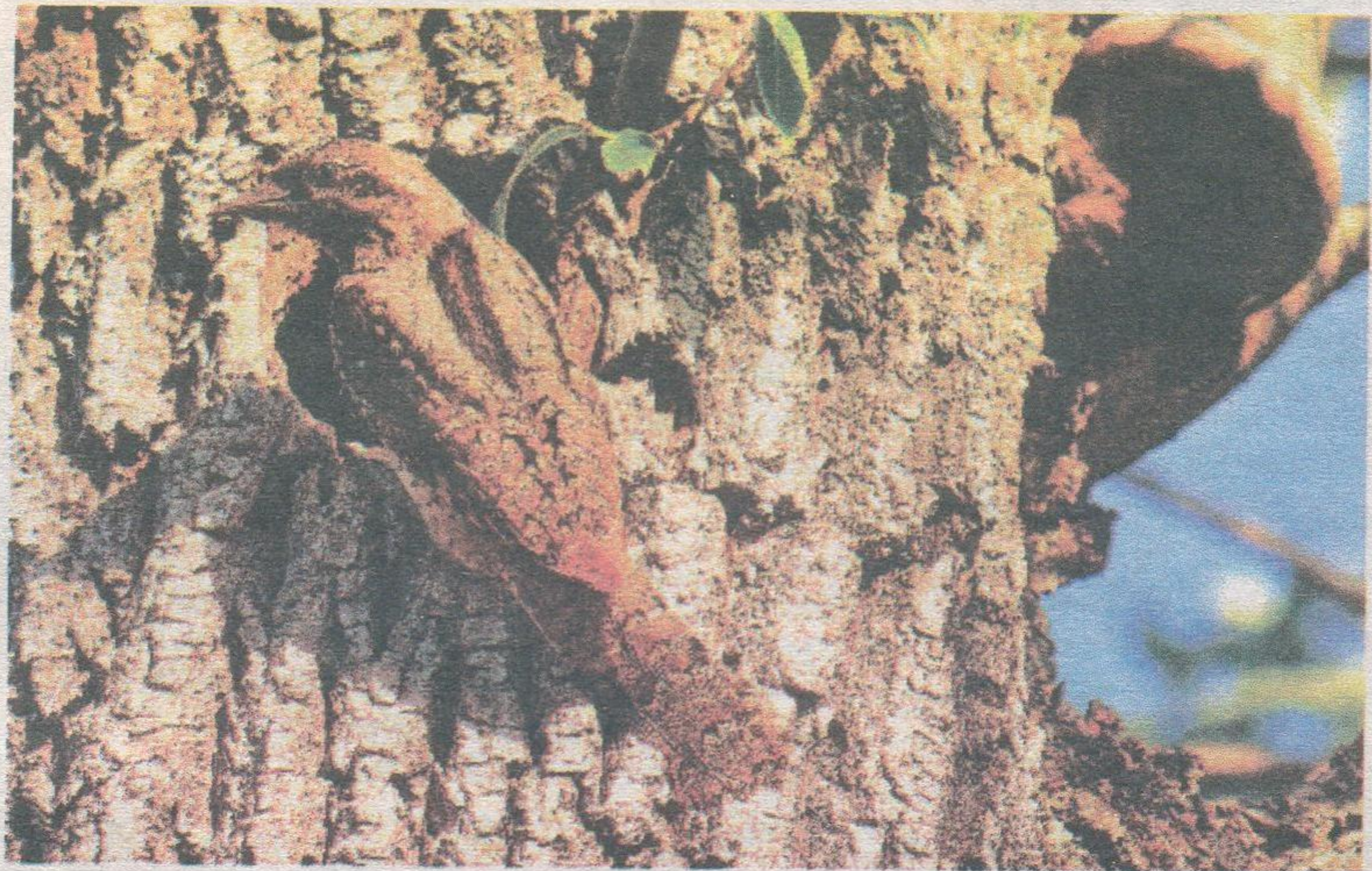
Дятел вертишейка у дупла.