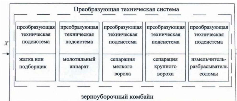
Рис. 2 – Зерноуборочный комбайн как преобразующая техническая система

На рисунке 2 показано, что технологический процесс зерноуборочного комбайна можно представить в виде модели, построенной по принципу «вход – выход».